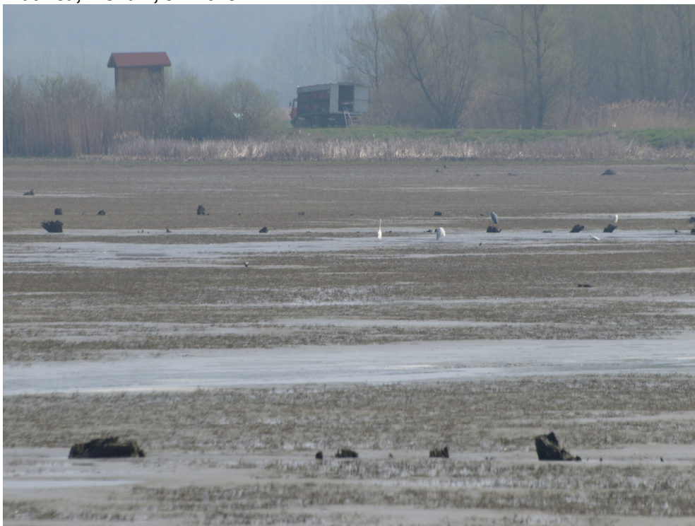
Blatnica, Ploha 8, 8.4.2018. Nije fotografirano